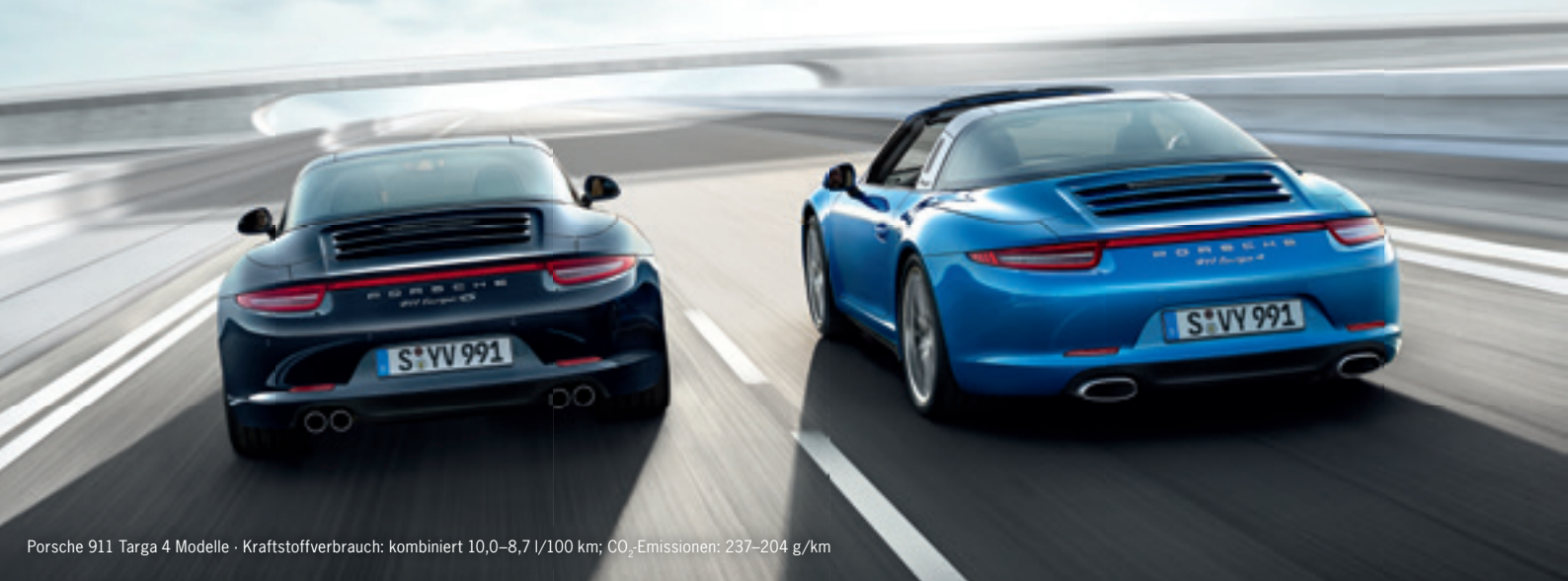
Porsche 911 Targa 4 Modelle - Kraftstoffverbrauch: kombiniert 10,0–8,7 l/100 km; CO 2 -Emissionen: 237–204 g/km

* mit Porsche Doppelkupplungsgetriebe (PDK)