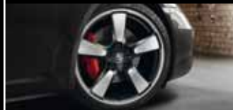
Nicht nur von Sammlern hochbegehrt: die Sport Classic Räder im legendären Fuchselgendingen.

Jubiläumsmodell 50 Jahre 911 mit 7-Gang-Schaltgetriebe in 4,5 s von 0 auf 100 km/h und erreicht eine Höchstgeschwindigkeit von 298 km/h. Ebenfalls zukunftsweisend sind die Verbrauchswerte, die der hohen Leistung des Jubiläumsmodells gegenüberstehen: Denn mit 8,7 l/100 km (in Verbindung mit dem optionalen PDK) liegen sie vergleichsweise niedrig. Grund dafür sind serienmäßige Effizienztechnologien wie Auto Start-Stop-Funktion, Thermomanagement oder Bordnetzrekuperation, die auch im Jubiläumsmodell 50 Jahre 911 integraler Bestandteil des Fahrzeugkonzepts sind.